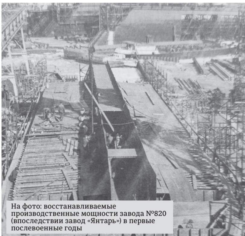
На фото: восстанавливаемые производственные мощности завода №820 (впоследствии завод «Янтарь») в первые послевоенные годы